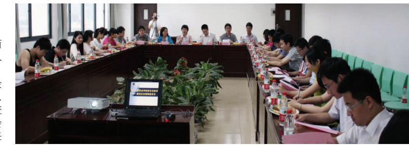
▲校友理事会座谈会

重要的载体,也是维系华夏人情感的重要方式。本屆理事会充分肯定我校绿色校园建设工作开展两年来取得的巨大变化,特别是让校友多年后首次返校的校友感慨万千。与会校友提出校友会在绿色校园建设方面可以开展学生课本捐赠、旧物传递等活动,提倡绿色环保理念,同时将绿色校园环保理念落实到实处。