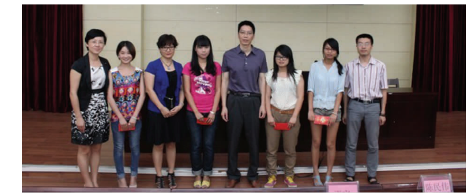
▲老师与四名赴美带薪实习学生合影

相关材料:赴美带薪实习项目起源于美国联邦政府通过的《信息及教育交流法案》,后在1961年纳入并扩展为《教育及文化平等法案》,是面向全世界大学生的暑期文化交流项目。学生持 J-1 签证进