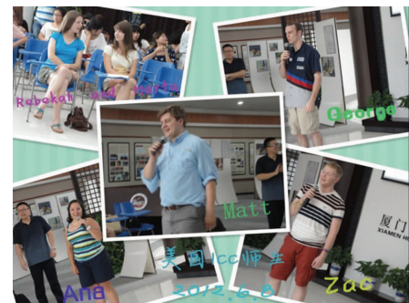
▲与 ICC 师生交流现场(报道四照片)

相信,这次活动不仅使同学们开拓了视野、增长了见识,而且形成了一个共识:If you want to learn English well, you'll have to speak English as much as possible.