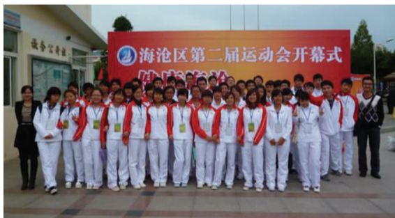
▲学生志愿者集体合照

彩排。志愿者们辛勤的服务不仅展现了高校青年吃苦耐劳、乐于奉献的精神,同时也展现了当代大学生积极向上、团结奋进的精神风貌。据运动会组委会表示,此次高校志愿者队伍是一支优秀的团队,工作效率高,做事认真负责,不仅很好的帮助了此次运动会的顺利进行,更重要的是很好地诠释了“健康海沧精彩区运”这个主题。参加此次志愿者的同学们纷纷表示,这次志愿者活动即锻炼了他们的团队意识,又使他们学到了很多新东西,同学们希望以后能参加更多类似的活动。