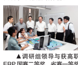
▲调研组领导与获高职ERP国赛二等奖、省赛一等奖师生互动交流