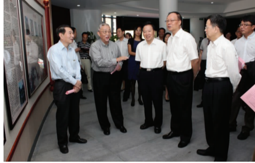
▲调研组领导视察校史馆—华夏厅,了解学校发展沿革