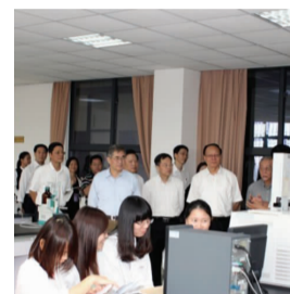
▲调研组领导关心学生实训学习、技能培养情况