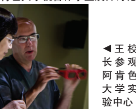
▲王校长参观阿肯色大学实验中心