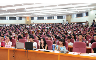
▲2013 级新生开学典礼现场

秋风送爽,丹桂飘香,又是一年迎新时。华夏学院迎来了 2100 余名 2013 级新生。9 月 9 日至 10 日,学校各系部分别举行了 2013 级新生开学典礼,学校领导及各系部教师参加大会。