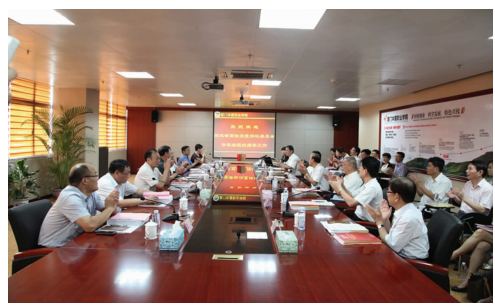
▲省高等学校设置评议委员会专家组在厦大听取办学情况汇报

受福建省教育厅委派,福建省高等学校设置评议委员会专家组一行 5 人于 7 月 20 日至 21 日,对在厦门华夏职业学院基础上申报组建厦门华夏学院进行了实地考察和评议。专家组听取了厦门华夏职业学院董事会、校领导关于学校情况汇报,实地考察了学校的科研平台、实验实训室、校史馆、图书馆等教学设施和其他办学条件,召开了董事会、校领导和教师座谈会、反馈会。