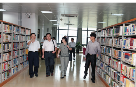
▲实地考察了学校的办学条件

厦门市副市长黄强在致辞中充分肯定我校办学所取得的成就。他指出,华夏职业学院创办以来,坚持公益办学,注重内涵建设和风险防范,为厦门特区建设培养了大批实践性强、可用性高的专业人才。学校“专升本”不仅是华夏人的不懈追求,也是厦门民办教育发展水到渠成的结果。厦门市将认真听取、吸收和落实各位专家的意见,加大对民办高校的扶持力度,继续出台针对性更强、指导性更大的扶持政策,促进民办教育品牌的形成;要坚持“精政办学”的方针,积极进行选择性教育、个性化教育和特色教育的探索,努力提升教育品质;建立必要的考核体系,将政府支持与教育办学的投入和成效有机结合,引导和激励真正热爱教育事业的社会人士投身教育、办好教育。