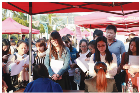
招聘企业深入了解学生情况

11 月 28 日,学校 2014 届毕业生校园双选会在篮球场隆重举行。此次招聘会吸引了来自北京、上海、天津、广州、深圳、福州、厦门、泉州、漳州以及国内大型企业的驻厦机构及用人单位共 269 家,提供了 5800 多个岗位。同时学校双选会也得到厦门新工作人才网、厦门海峡人才网和厦门人才网的大力支持。我校 2014 届 1900 多名毕业生到场应聘。