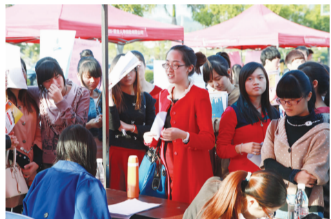
详细咨询岗位情况