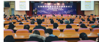
生物医药创新平台学术研讨会

2014 年 1 月 5 日,由厦门市应用技术研究院、厦门华夏职业学院联合举办的“生物医药学术研讨会”在我校隆重召开。本次会议主要就生物医药发展领域的前沿技术展开讨论,重点聚焦癌症治疗新技术