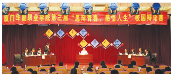
学校第三届“思辨青春,感悟人生”辩论赛总决赛

赛后,校团委宣传部记者团对观众、选手们进行采访。校园辩论赛培养了华夏学子的逻辑思维和语言组织能力,善于思考、敢于对问题的进一步思索,激发了华夏学子对知识的探索精神。另一方面,校园辩论