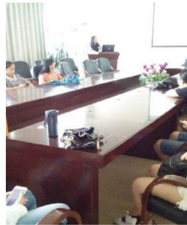
图书馆知识小讲坛