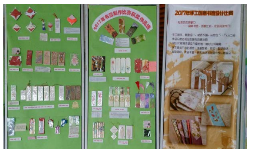
书签大赛获奖作品