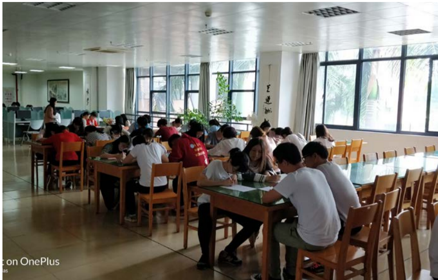
图书馆知识 及文献检索 技能竞赛