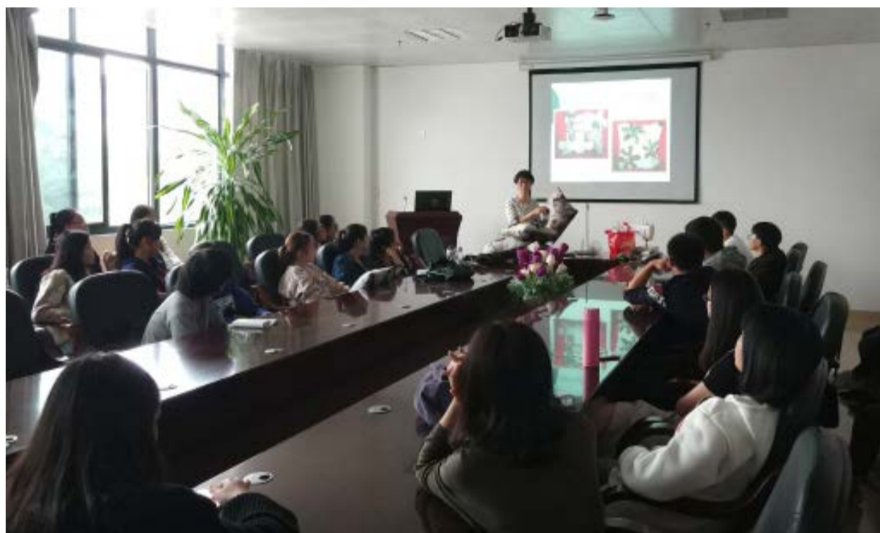
图书馆知识小讲坛—— 环保手工布艺作品制作教程