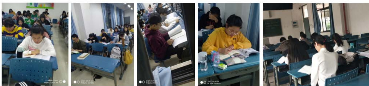
晨读活动开展第一天

我们有一种天生的惰性，总想着吃最少的苦，走最短的弯路，获得最大的收益。有些事情，别人可以替你做，但无法替你感受，缺少了这一段心路历程，你即使再成功，精神的田地里依然是一片荒芜。成功的快乐，收获的满足，不在奋斗的终点，而在拼搏的过程，该你走的路，要自己去走，别人无法替代。晨读带给我们的道理亦是如此，不去亲身体会，永远不会得到收获，所以读协鼓励华夏学子抛开温暖的棉被，迎着厦门清晨的风，来到教室张开嘴，拿起笔感受阅读，感受学习快乐，学会自律，学会坚持！